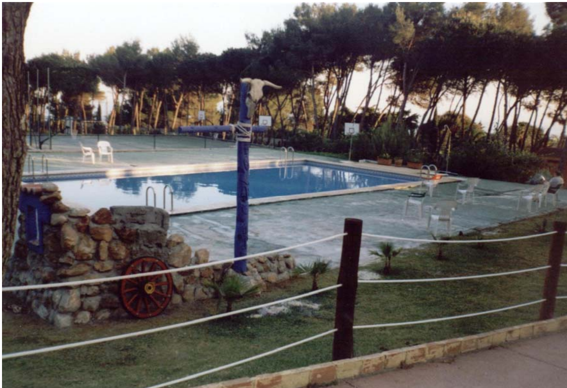
Piscina del Fuerte de Nagüeles